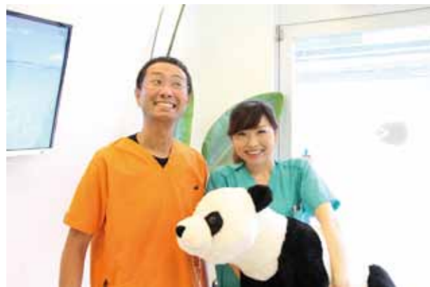
待合室のアイドル、パンダのぬいぐるみと