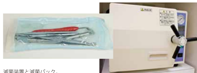
滅菌装置と滅菌パック。 1回ごとに滅菌してパックしています。

な待合室では患者さんが汚れを運んできてしまいます。ですから当院では先に挙げた4つの項目を基本として診療体制をつくっています。もちろん患者さんのお口の中に入る器具は滅菌済、そして患者さんの体に触れるものは使い捨てのものを使用しています。