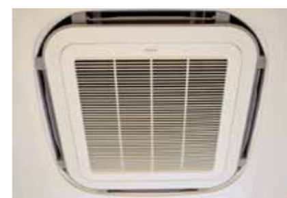
特殊空気清浄機。 0.01μmの粉塵まで除去します。

医療機関として当たり前のことですが、最も大切にしていくことが、消毒滅菌です。タカバナ歯科での感染予防の考え方は、掃除・清潔・消毒・滅菌の4項目を平行して実施することで成り立っています。いくら滅菌をしても、ほこりっぽい診療室ではせっかくの滅菌もだいたなしです。いくら診療台を消毒しても不潔