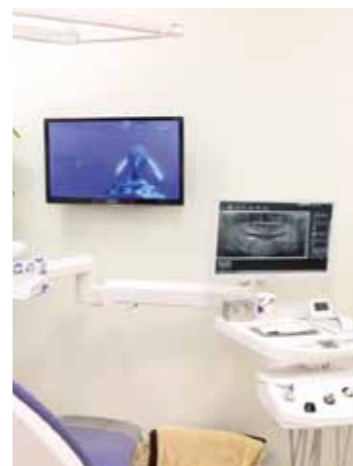
診療チェアに備えつけのディスプレイ。 さまざまなご説明に活躍します。

まず私たちがお話しするのではなく、患者さんのお話を傾聴します。受診前に書いていただいた予診表をベースに、患者さんのお話に耳を傾けます。全身的なこと、ライ