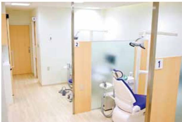
プライバシーを守る診療室